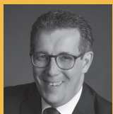
Landrat Peter Polta Landkreis Heidenheim